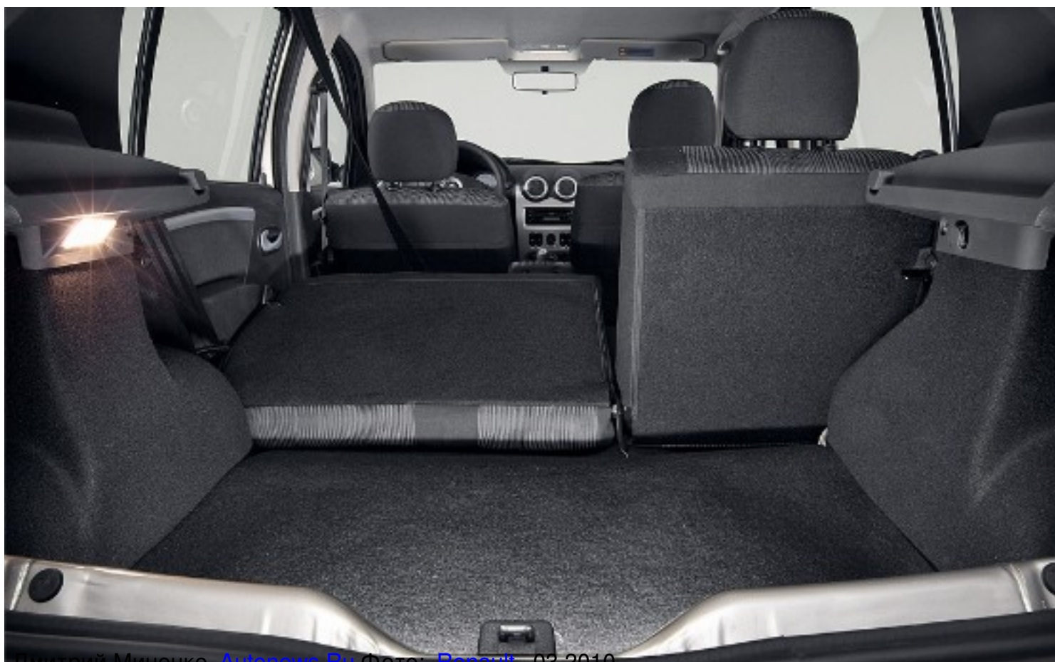
Дмитрий Миненко Autonews.ru 03.2010