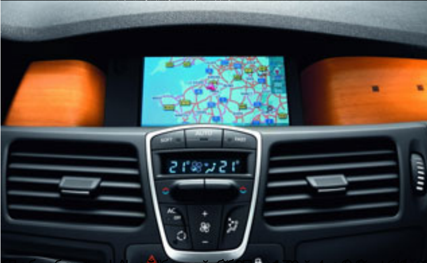
«Рено» - это не просто автомобиль, это стиль жизни