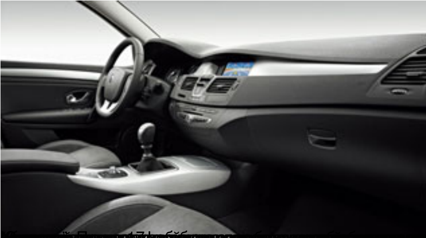
«Рено» - это не просто автомобиль, это стиль жизни