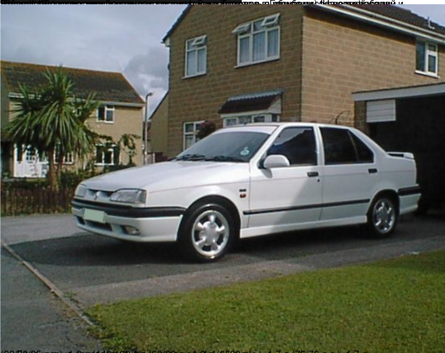
(92/95/95 л.с.) в д.в.п. (140/162,4 л.с. / 160/68 л.с.), 1,9 л (6580 л.с.), 1,7 л (75/76 л.с.), 1,7 л