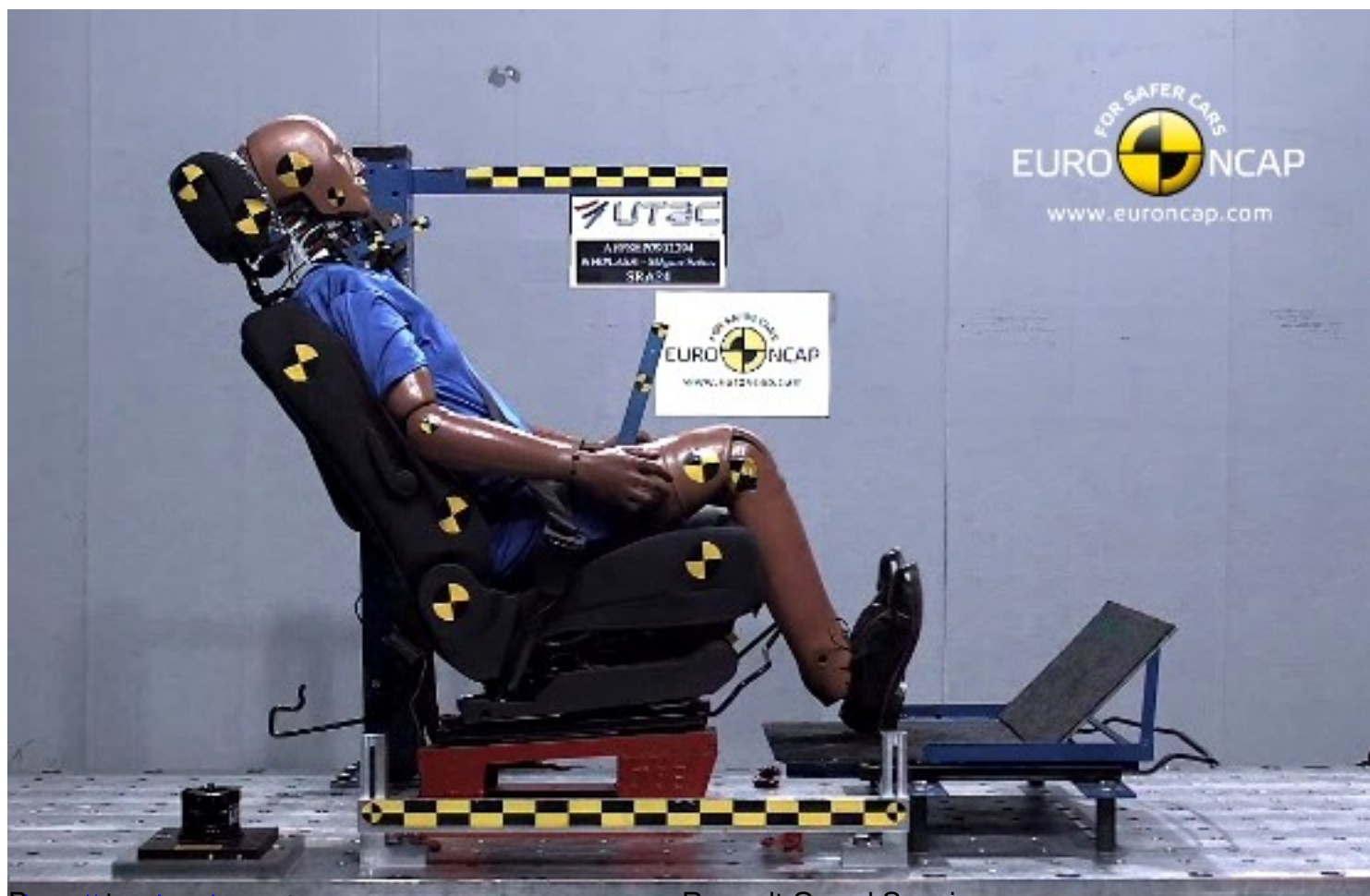
Видеофильм о проведённом краш-тесте нового Renault Grand Scenic: www.renault.com и http://www.euroncap.com