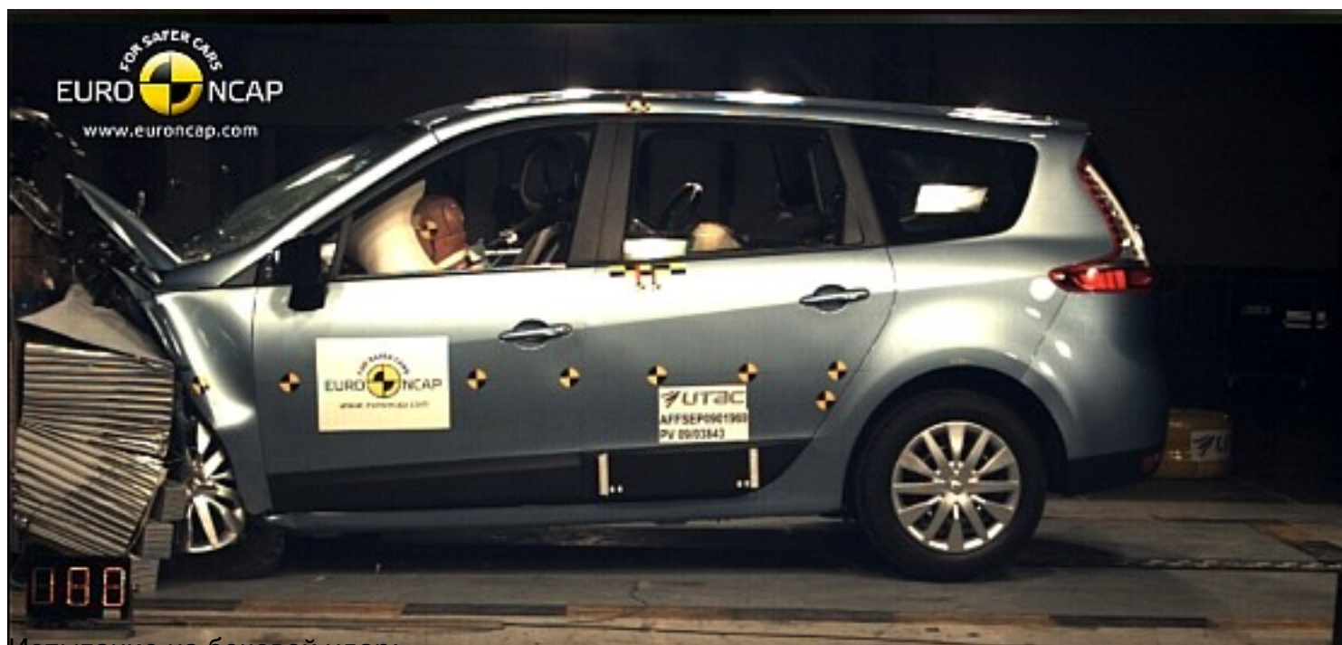
Испытание на боковой удар: