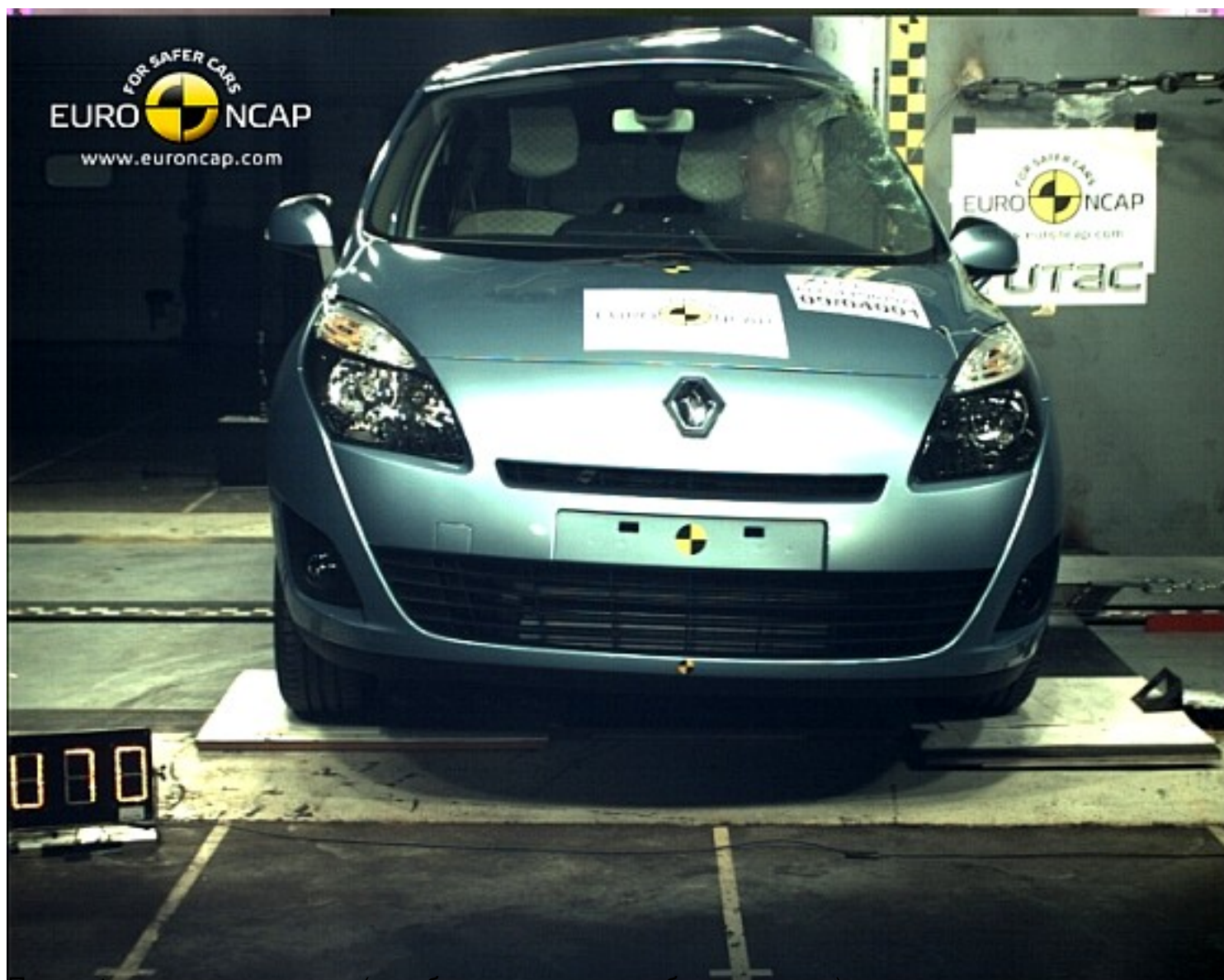
После фронтального удара (сработавшие подушки безопасности).