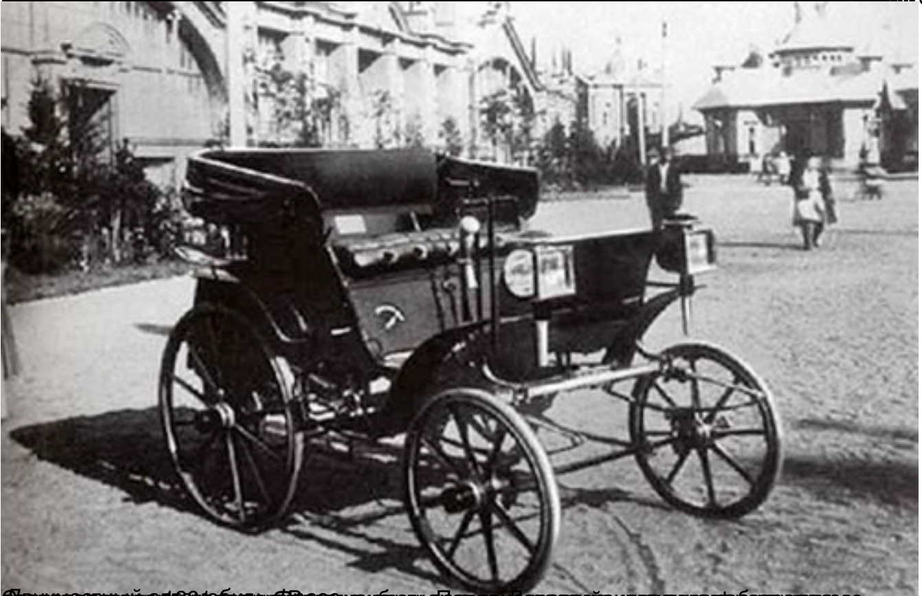
Продавца автомобиля в Москве, в то время еще называвшегося «автомобильная фабрика»