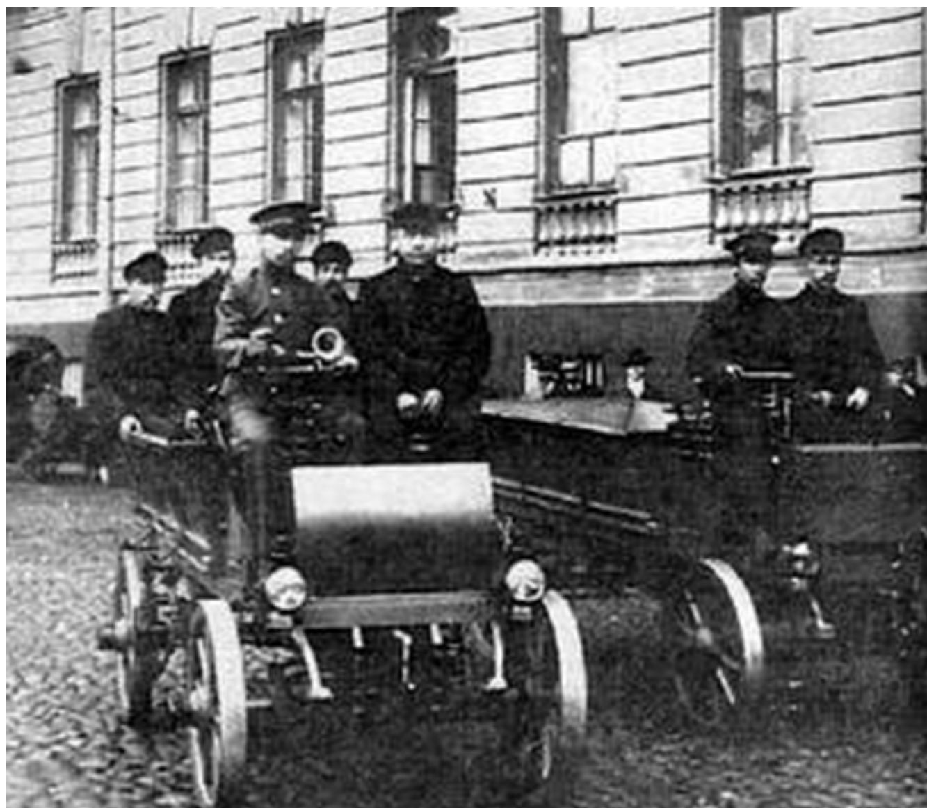
Вид сзади на автомобиль Renault 40HP, 1905 г. в Париже. Д.