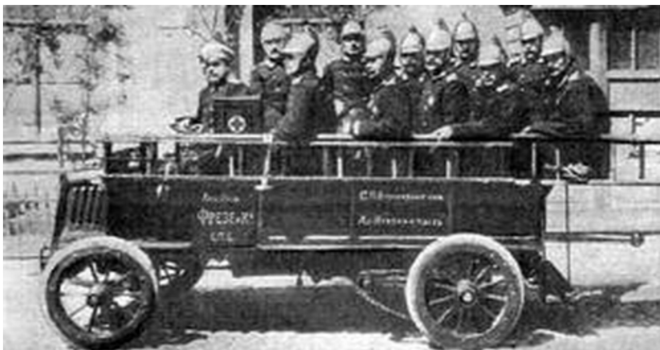
Автомобиль Фрезери С.С.С.Р. - Военные силы. История Renault - фото и видео